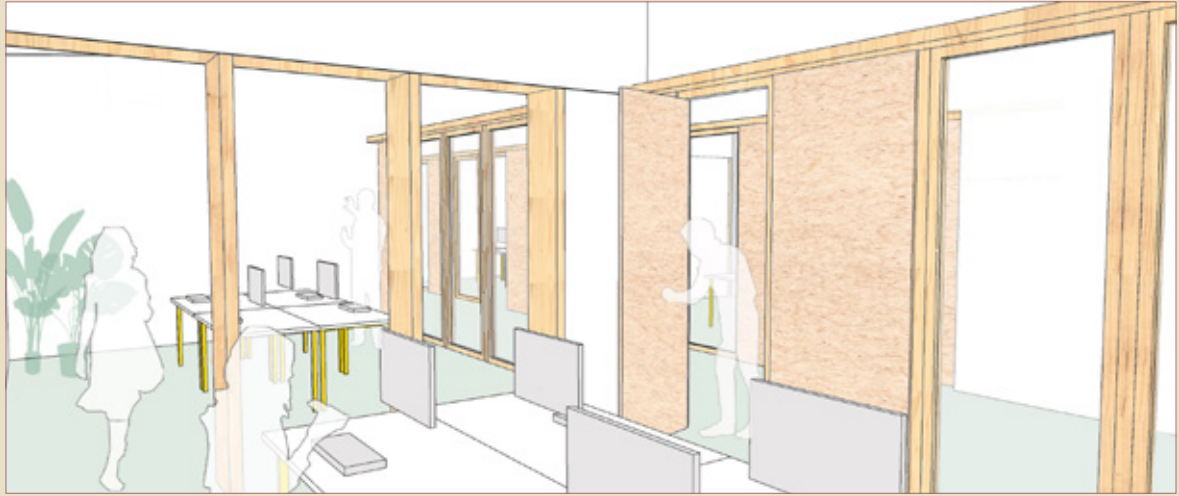
Bulegoa barnealdetik Elkartutako bi bulegoren bista

Goierriko Polo Kooperatiboa izango denaren garapena ordea, Biziolak eskualdeko zenbait eragilerekin elkarlanean eman beharreko pauso batekin lotuta dago. Dagoeneko badira bi urte gaur Biziola kokatuta dagoen fabrika alokatu genuela. Orduko hartan, erosketa aukera jasotzen zuen hiru urterako alokairu kontratu bat adostu zen fabrikaren jabearekin. Beti ere, alokairuan ordaindutakoa, balizko erosketa bateko eraikinaren prezioetik deskontatuko zelaririk. Goiko solairuan espazio berriak martxan jartzeko apustua egingo bada, eraikina erosteko apustuaren eskutik joan beharko da ordea; ezinbestean, batean egin beharreko inbertsioak, iraunkortasunerako segurtasuna eskatzen baitu eraikinaren erabileran.