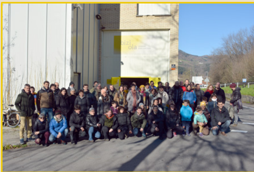
Urtarrileko batzar orokorreko argazkia

2023ko urtarrilaren 20an ireki ziren Biziolako ateak. Urtebete egin berri du efemeride hark. Baina izebergaren metafora baliatuz, egun horretan proiektuaren puntatxo bat ikusi bazen ere, Biziola denbora luzez eta esku askoren borondatezko lanaren bidez eraikitzen joan den proiektua da. Goierrin eskualdetik eta eskualderako ekonomia sozialetik etorkizunera begirako proiektu eraldatzaileak martxan jarri armoz sortu zena. Ondoko helburu hauekin: