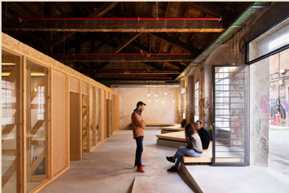
Coòpolis, Ateneu Cooperatiu , Bartzelona

Goierriko Polo Kooperatiboa izango denaren garapena ordea, Biziolak eskualdeko zenbait eragilerekin elkarlanean eman beharreko pauso batekin lotuta dago. Dagoeneko badira bi urte gaur Biziola kokatuta dagoen fabrika alokatu genuela. Orduko hartan, erosketa aukera jasotzen zuen hiru urterako alokairu kontratu bat adostu zen fabrikaren jabearekin. Beti ere, alokairuan ordaindutakoa, balizko erosketa bateko eraikinaren prezioetik deskontatuko zelaririk. Goiko solairuan espazio berriak martxan jartzeko apustua egingo bada, eraikina erosteko apustuaren eskutik joan beharko da ordea; ezinbestean, batean egin beharreko inbertsioak, iraunkortasunerako segurtasuna eskatzen baitu eraikinaren erabileran.