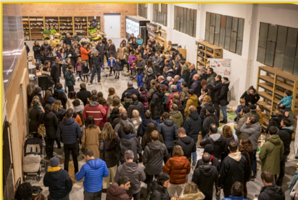
Biziola Fabrikaren irekiera ekitaldiko argazkia

Bide horretan ekarpen komunitario-kooperatibo bat egin asmoz sortu zen Biziola Kooperatiba. Orain bidean pauso berri bat eman eta eraldaketa proiektu ezberdinen katalizatzaile izango den polo kooperatiboa jarri nahi du martxan Goierriin. Horretarako zuen denon laguntza ezinbestekoa delarik.